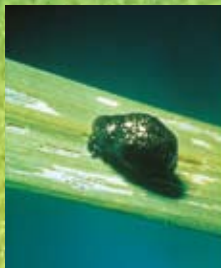
イネドロオイムシ幼虫