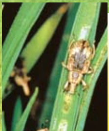
イネミズゾウムシ