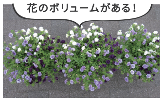
A剤 ジャストワン液肥 B剤