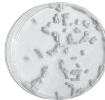
スラゴ® 浸水24時間後