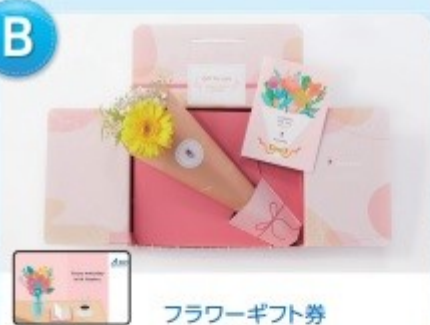
フラワーギフト券