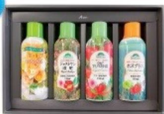
家庭園芸用肥料と美咲 合計4本セット